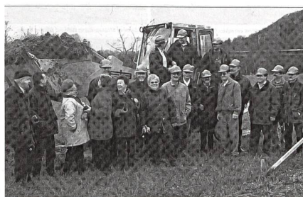
Spatenstich am Wiggerspitz im Jahre 2000.

Nach langer Zeit der Suche nach einem neuen Standort hiess es 1999 «Aarburg – Land in Sicht». Die zuvor geprüften Standorte in Härkingen SO, Gunzgen SO und Olten SO, unterhalb des Restaurants Höfli, konnten nicht umgesetzt werden. Richtig beheimatet und bestens installiert ist man nun seit dem Jahr 2000 im Aarburger Wiggerspitz. Der Spatenstich auf dem Gelände von 120 Aren Grösse, von der Gemeinde im Baurecht zur Verfügung gestellt mit der Auflage, den Kiosk für die angrenzende Badi zu führen, erfolgte am 6. März 2000. Nach umfangreichen Bauarbeiten konnte der Campingplatz Wiggerspitz bereits am 13. Mai desselben Jahres eröffnet werden.