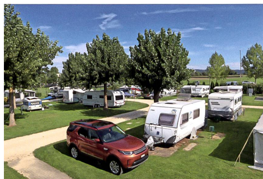
Der Campingplatz Wiggerspitz weist grosszügige Parzellen auf.

Der fünfköpfige Vorstand leitet die Geschicke und die Entwicklung von Klub