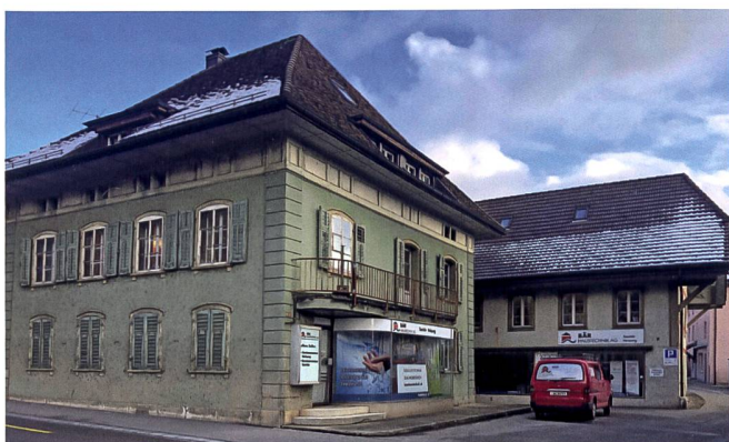
Liegenschaft an der Sägestrasse vor ...