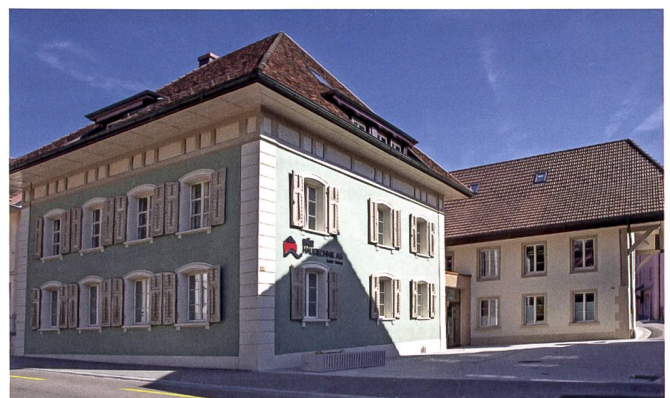
... und nach dem Umbau.