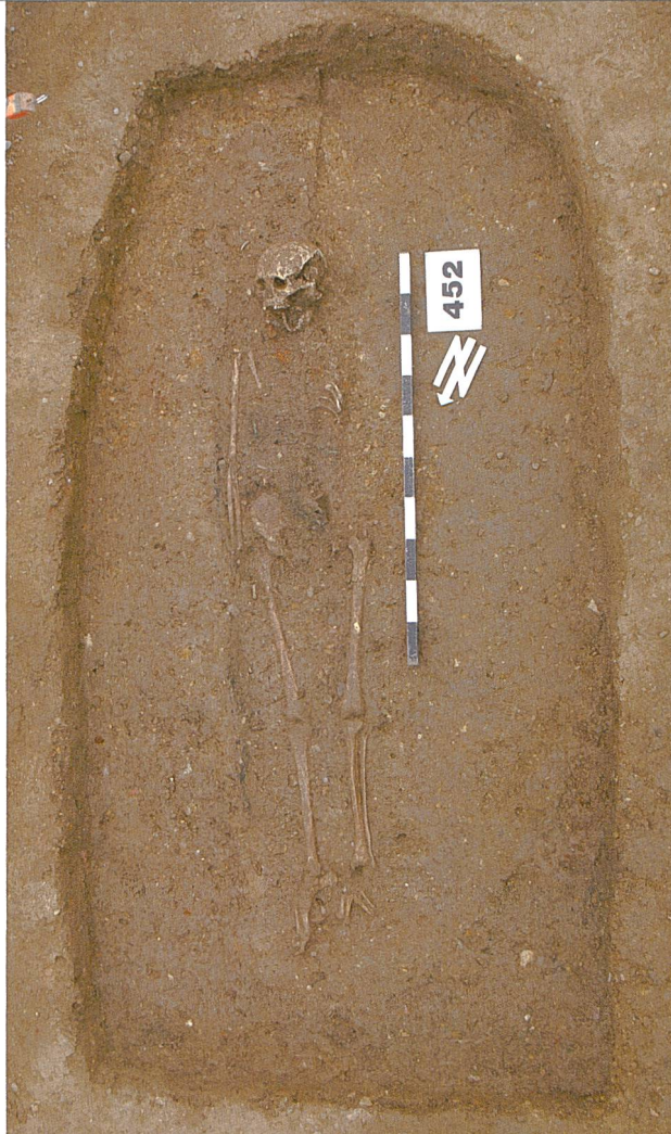
Pratteln, Meierhof. Das latènezeitliche Frauengrab während der Freilegung (links) und in der Umzeichnung mit Fundlage der Grabbeigaben gemäss der Analyse der Röntgenbilder (rechts).