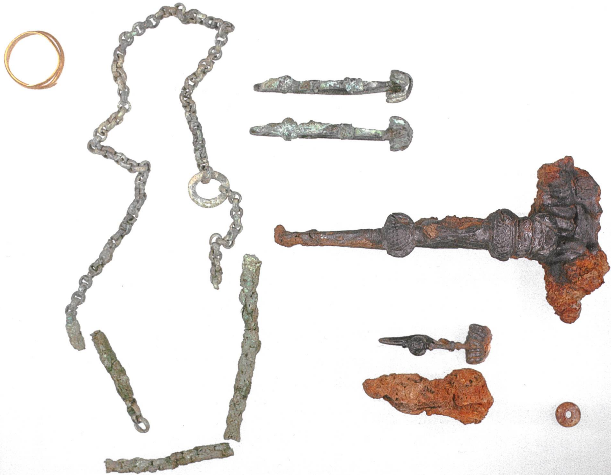
Die Beigaben aus dem Frauengrab der mittleren Latènezeit: Goldfingerring, Gürtelkette, Bronze- und Eisenfibelpaar, grosse Einzelfibel aus Eisen sowie Bernsteinperle. Die eine Eisenfibel bleibt wegen der daran festkorrodierten Textilreste unkonservert.