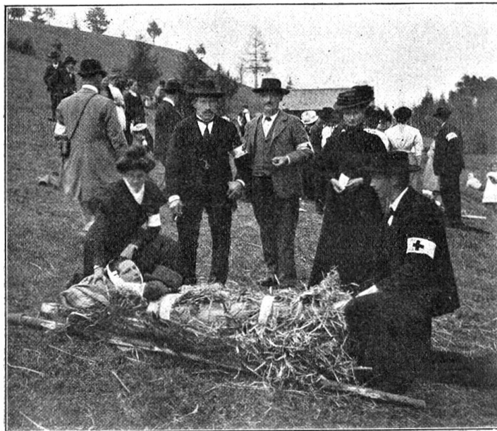
Feldübung in Diemtigen. Nach der Kritik.

balb einmal aber begann sich der Weg zu senken und zwar oft sehr bedeutend. Bei einem Bauernhause zwang uns ein heftiger Regen Halt zu machen. Nicht