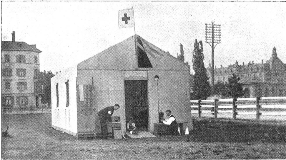
Zelt des Samaritervereins Wiedikon. Außen-Ansicht.

Waren auch zur Uebernahme des Dienstes die Grundlagen im Vereine gegeben, so erforderte ein gutes Gelingen desselben noch allerlei weitere Vorkehrungen. Das Dienstverhältnis wurde vertraglich geordnet, Transport- und Verbandmaterial sowie die Medikamente auf ihre Vollständigkeit durchgeprüft, ein paar zerbrochene Fensterscheiben des Lazarettes durch neue ersetzt, sodann das diensttuende