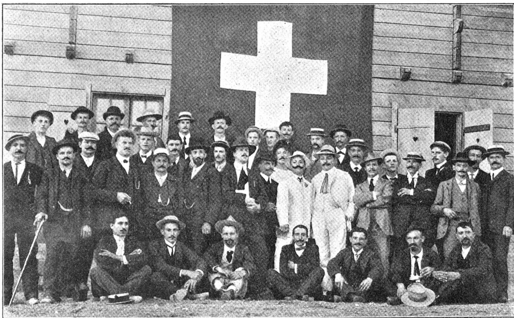
Bundesfeier in Reggio, 1. August 1909.

32 Wohnungen zu drei Zimmern, Küche, Veranda und Abort zu vergeben und nicht weniger als 260 Familien bewerben sich darum! Dabei werden alle irgendwie erreichbaren Einflüsse in Bewegung gesetzt und es macht sich das Temperament des Italieners sehr lebhaft geltend. Jeder erklärt sich selber für den Allercärmsten und Bedürftigsten und kann es nicht fassen, daß nicht er vor allen andern Berücksichtigung findet. Dabei muß gesagt werden, daß in all dem die Ubertreibung