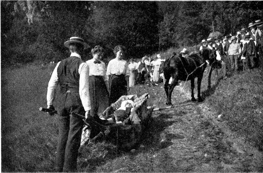
Transport mit Schubkarren und Pferd.

während zwei Stunden entwickelte sich nun ein reges und imponantes Lagerleben. Doch nur zu bald er-