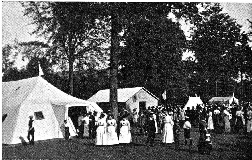
Samariterversammlung Zürich. — Feldübung vom 13. Juli 1913.

wurden. Sofort wurde die Einteilung zur Arbeit vorgenommen. Abteilungsweise wurden folgende Arbeiten begonnen: Aufstellung von einem großen Spitalzelt (Sektion Außer-Rodl) mit 12 Betten, Vorraum