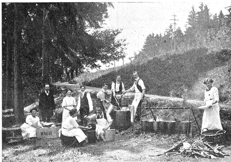
Samariterversammlung Zürich. — Feldküche, 13. Juli 1913.

für Empfang und Operationsraum, eine große Spitalbaracke, Niegelbau mit Blachwandung und Bedachung für 10 Betten (Sektion Neumünster), ein