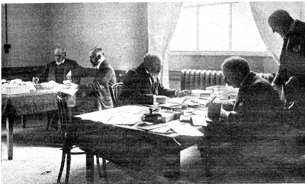
Die Mitglieder der Agentur für Kriegsgefangene an der Arbeit.