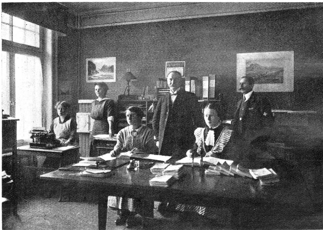
Kanzlei des Rot-Kreuz-Chefarztes.