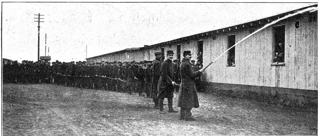
Aus den Gefangenenlagern Deutschlands. — Spritzenprobe.

etwas monoton aussehen, aber den hygienischen Anforderungen entsprechen sollen. Das zweite