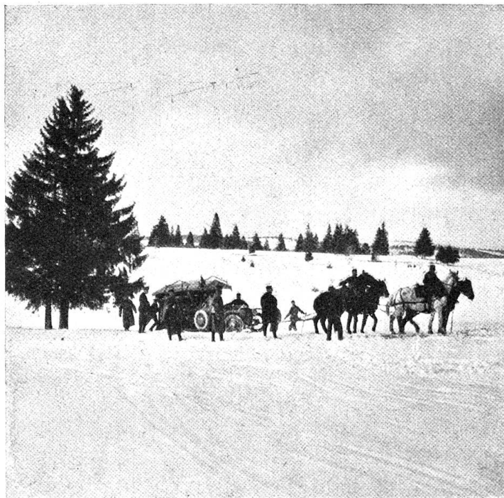
Vom Verfuhrkurs. — Energische Nachhülfe.

ich, ich kann nicht anders". Im Hintergrund sieht man die andern Autos in Kolonne folgen. Allein auch da weiß man, sich zu helfen.