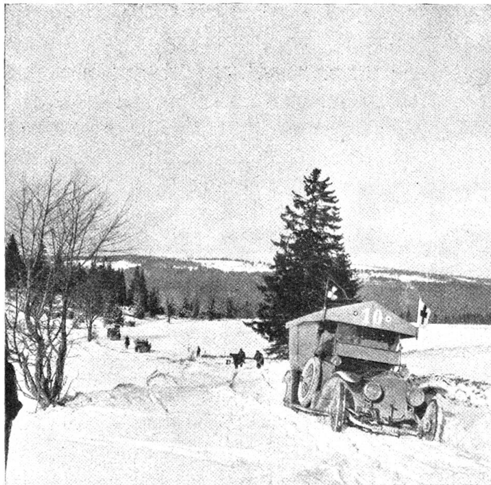
Vom Verfuchskurs. — Auto im Schnee.

Automobilstraßen, sondern, weil sie eben Verwundete bringen müssen, auch um Ueber-