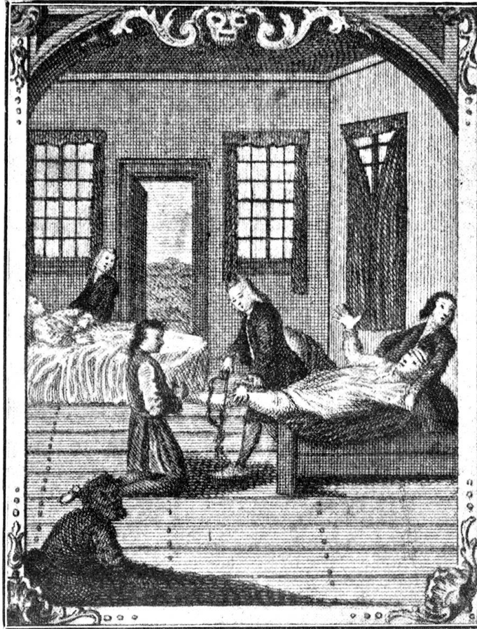
Eine Beinamputation nach einem alten Holzschnitt.

Ein wahrhaftiges Gruseln aber könnte einem befallen, wenn man z. B. liest, was der Wundarzt Felix Würz in seinem „Wundarznei-Buch“, das sein Bruder Rudolph Würz*) (ebenfalls Wundarzt), anno 1612 in Straßburg frisch drucken ließ, über die „Mißbräuch in der Blutstillung“ geschrieben. Es heißt dort: „Noch ist alles gering zu schätzen gegen den