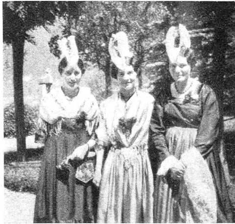
Unsere Sängerinnen in Schwyz.

bewundert und die so stille, liebe Art und Führung der guten Nonnen hatte auf sich wirken lassen, dem füllte das Eröffnungswort des Rotkreuzpräsidenten das Herz erst recht mit Hochachtung, als er ehrend von den 8000 Schülerinnen der Krankenpflege sprach, die von diesem Hause in 11 Länder hinaus, vor allem nach Amerika, die hohe Kunst und Kraft der Barmherzigkeit gegen alle Leidenden in geweihten Händen trugen. Die Einladung, gerade hier zu tagen, ist vom schweizer. Roten Kreuze durch den Mund seines neuen Führers besonders gerne verdankt worden.