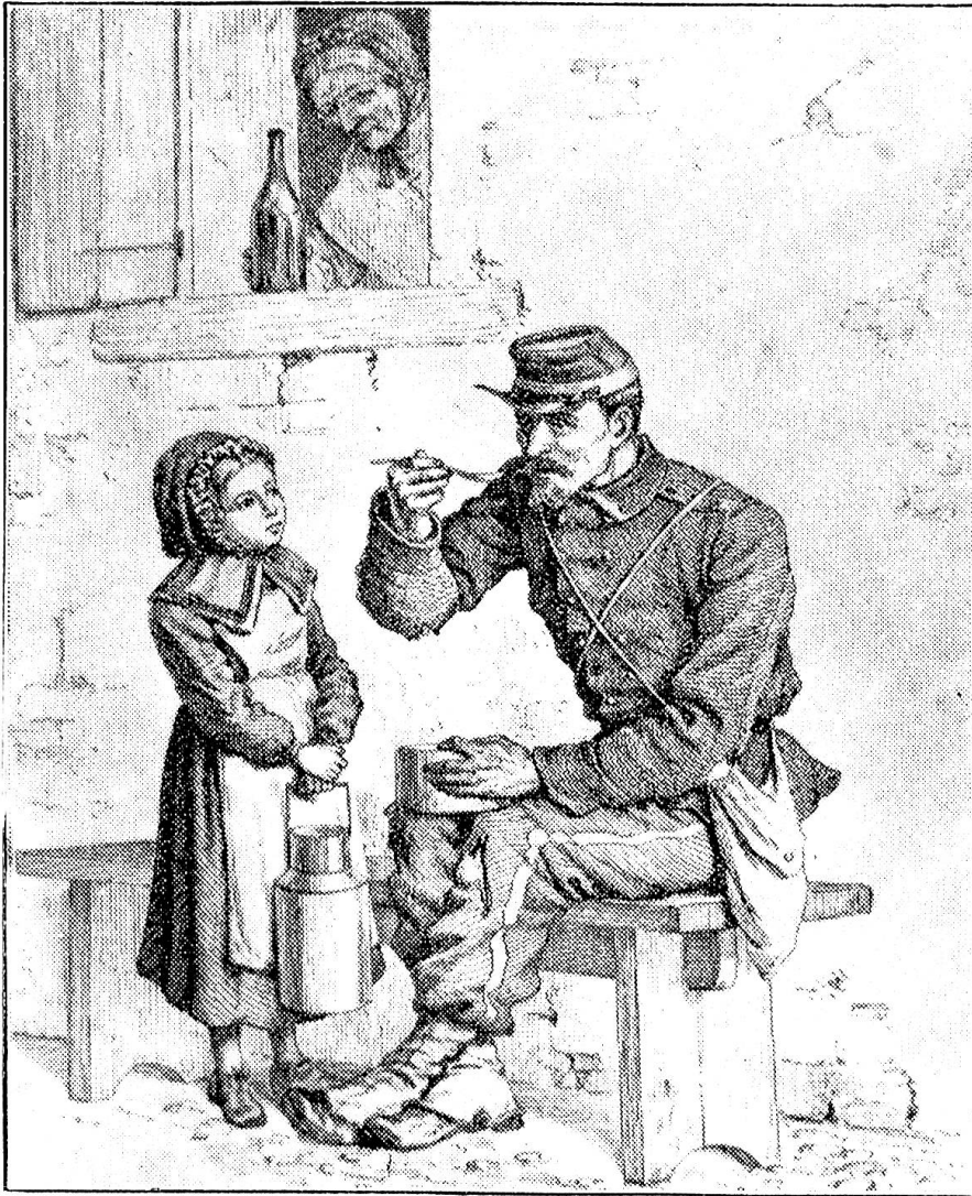
Accueil fraternel d'un soldat français, en 1871.

Gothard obstrué par l'hiver, notre vie régulière, celle des maisons d'école utilisées à d'autres buts, celle des temples et de nombreux de nos intérieurs fut lit-