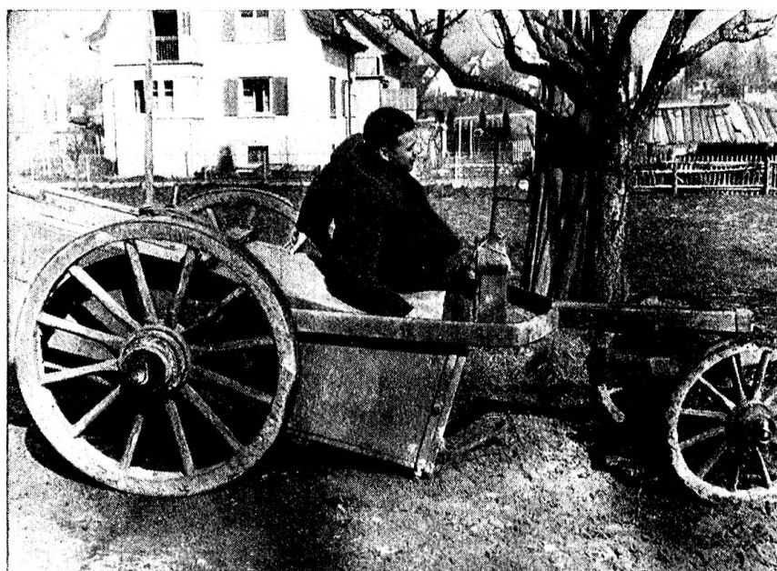
La caisse à purin traîne à terre.