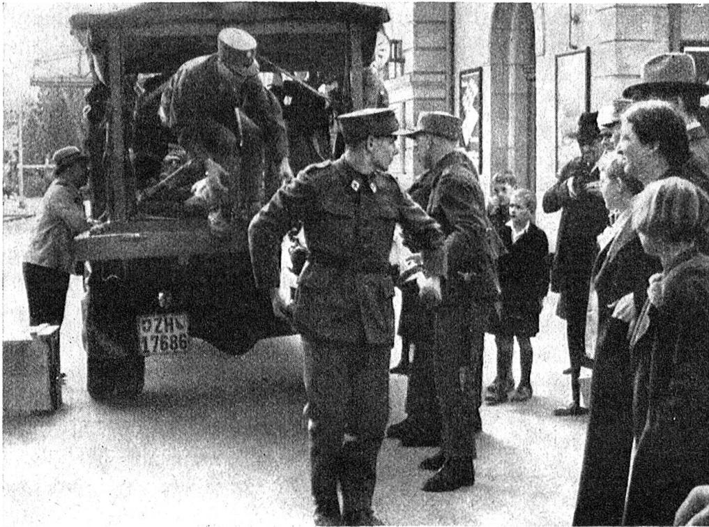
Ausladen eines Verwundeten durch Leute einer Rotkreuzkolonne.

sich auch mit den Organisationen der freiwilligen Hilfe in Verbindung zu setzen haben, damit sie von diesen in personeller wie in materieller Hinsicht unterstützt werden. Ich möchte meinerseits an die Adresse der in Betracht fallenden Zweigvereinsvorstände die Aufforderung des Herrn Oberfeldarztes wiederholen, dass da, wo die Inangriffnahme der entsprechenden Vorarbeiten noch nicht erfolgt ist, von seiten des Roten Kreuzes die Initiative zu ergreifen sei. Neben der Erledigung der personellen Fragen wird hier vor allem die Materialbeschaffung zur Installation eigentlicher Militärspitäler für die Korpssammelplätze einige Schwierigkeiten verursachen. Ich werde in anderem Zusammenhang gleich darauf zurückkommen. Was die Personalangelegenheiten anbelangt, so sei auch einmal daran erinnert, dass bei einer Mobilmachung die Be-