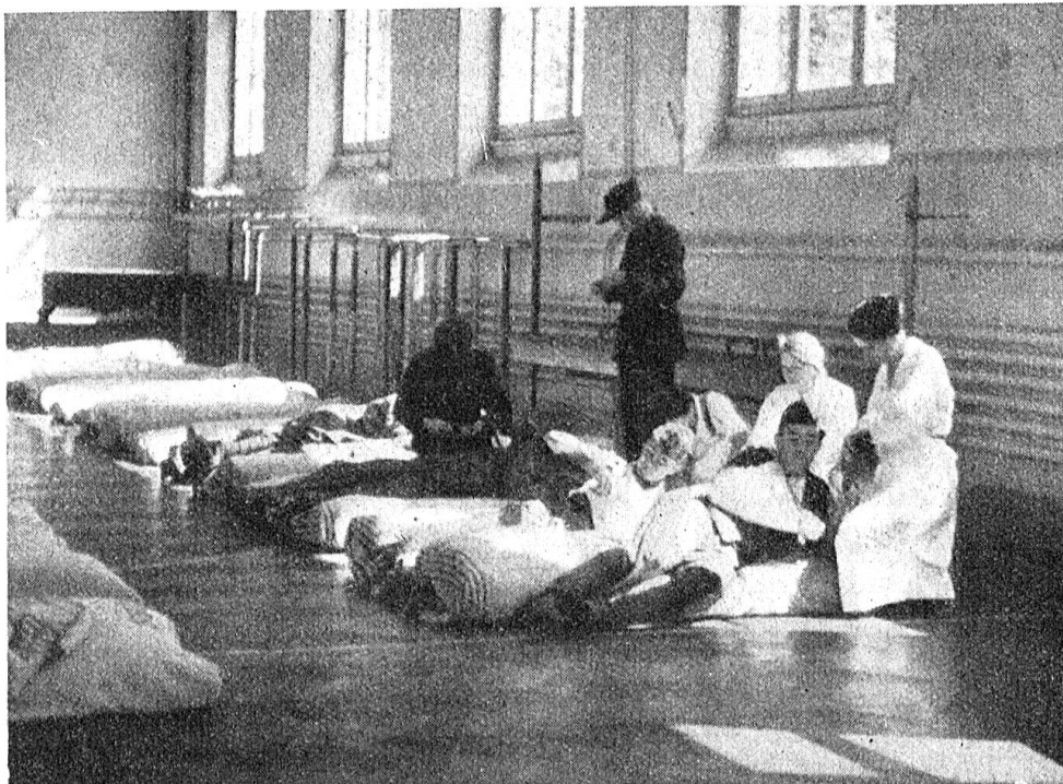
Errichtung eines Hilfsspitals durch Rotkreuzkolonnen und Samariter.

vereinsvorstände zu beschäftigen haben, und die Zusammenarbeit mit den lokalen Vertretern der Frauenorganisationen wird mit einer der kommenden Aufgaben bilden.