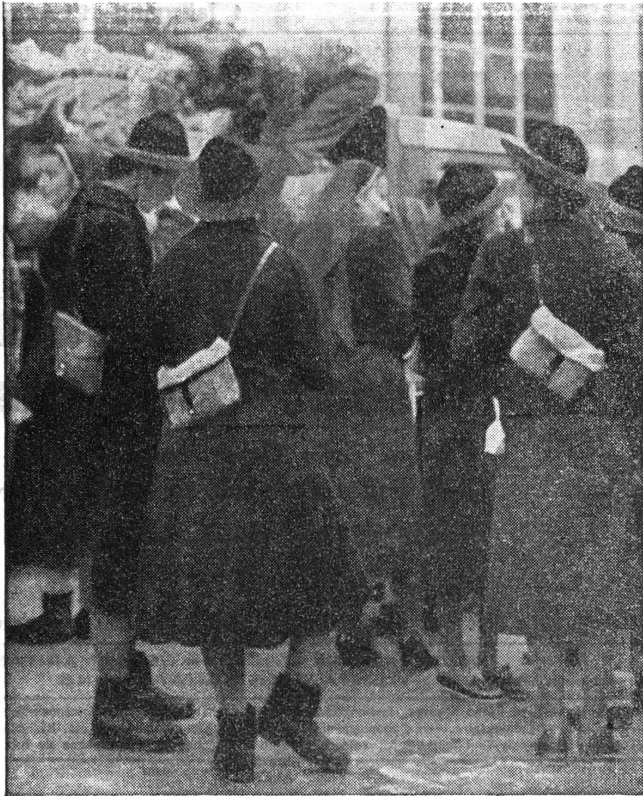
Infirmières et éclaireuses mobilisées

repart, emmenant au loin les wagons de soldats. (Au fond de soi, on pense à d'autres trains de soldats, et l'on se demande si la Suisse conservera sa neutralité...)