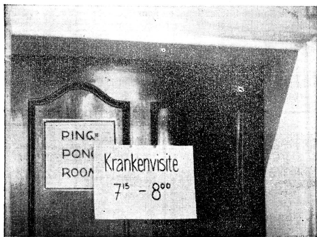
Aus einer Militärsanitätsanstalt. Aus dem Ping-Pong Room ist ein Krankensaal geworden. Schlagfertige Reden fliegen wie Bälle von Lager zu Lager; der kameradschaftliche Soldatenton herrscht auch bei den Kranken und überdeckt mit heiterer Resignation Schmerzen und trübe Nachrichten.

Bei den Wundinfektionen mit Anaerobiern gilt zwar immer noch der Satz, dass die sachgemässe primäre Wundversorgung im ersten Rang steht, und dass die spezifische Serumprophylaxe nur eine unterstützende Massnahme ist. Die Erfahrungen der letzten Weltkriegsjahre lehren nun aber auch hier, dass durch eine frühzeitige und ausgiebige prophylaktische und therapeutische Applikation hochwertiger Anaerobensera die Letalität dieser Wundinfektionen ganz bedeutend herabgesetzt werden kann, und viele sonst notwendig werdende Amputationen überflüssig macht. Die Bereitstellung grösserer Mengen hochwertiger polyvalenter Anaerobensera für die Armee ist sicher demnach angezeigt. Es ist nun aber nicht zu verkennen, dass dieser Serum-