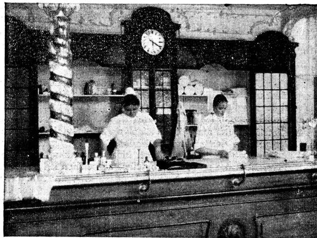
Aus einer Militärsanitätsanstalt. Zwischen dem Prunk und den gewundenen Marmorsäulen, wo einst der Barkellner zu grellen Klängen einer Jazzmusik den Cocktail mischte, verwalten jetzt ruhige Schwestern die Apotheke der M. S. A. «Ist alles bereit für Abteilung III?» «Es fehlen noch die Kompressen. Einen Moment! Ich zähle sie gleich nach.»

prophylaxe und Serumtherapie auch alle Nachteile einer passiven Immunisierung anhaften, nämlich, dass der verliehene Schutz nur kurzfristig ist und infolgedessen bei einer spätern neuen Verletzung wiederholt werden muss, wobei natürlich anaphylaktische Zustände stets zu befürchten sind. Ausserdem ist die Serumtherapie bei den Anaerobieninfektionen — durch die oft nicht zu umgehenden, wiederholten intravenösen Injektionen — bekanntlich ziemlich umständlich. Und schliesslich kann auch als Nachteil empfunden werden, dass die Beschaffung grosser Serummengen mit ausserordentlichen Kosten verbunden ist.