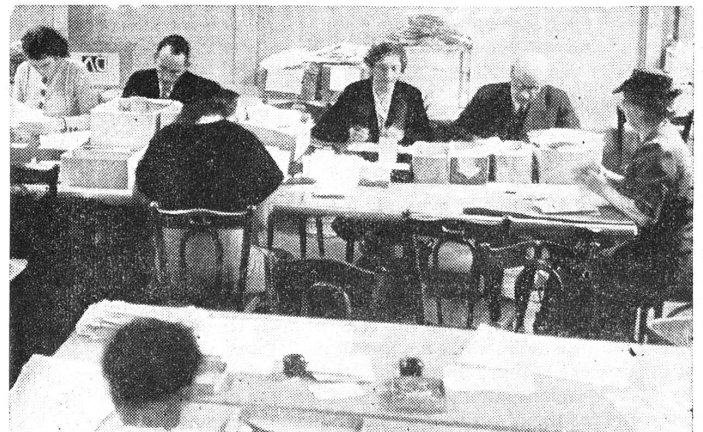
Le service polonais a du travail plein les bras.