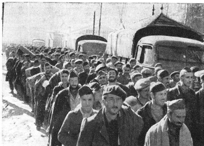
Le Perthus. 2000 prisonniers de guerre nationalistes aux mains des Gouvernementsaux sont remis par la police espagnole républicaine aux autorités françaises.

Croix-Rouge, en raison de son autorité reconnue et de son indépendance incontestée, a été chargé de remplir le rôle de la puissance protectrice et de notifier au Gouvernement italien l'envoi et l'établissement sur territoire éthiopien de ces ambulances étrangères venues au secours des blessés. La Croix-Rouge italienne, par le canal de laquelle cette notification eut lieu, s'est toujours prêtée à la transmission de ces notifications à son propre Gouvernement.