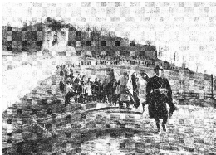
Prats-de-Mollo. Sous la conduite d'un garde-mobile les prisonniers espagnols se mettent en route pour Le Perthus où s'effectuera leur rapatriement par les soins des délégués du Comité international.

On voudrait pouvoir parler longuement de la Commission financière , signaler des sommes considérables mises à la disposition du Comité. Hélas! il faut bien le reconnaître, si les sociétés nationales de la Croix-Rouge font leur possible pour collaborer pécuniairement aux dépenses engagées par le Comité, si certaines entreprises privées et certains particuliers font des gestes dont on ne saurait leur être trop