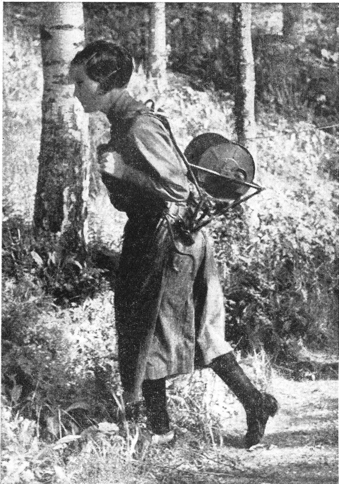
Lotta-Svärd-Verein: Ziehen von Feldleitungen.

Wetzikon. S.-V. Schlussprüfung des Samariterkurses: Samstag, 16. Dezember, 19 Uhr, im Hotel «Löwen», Ober-Wetzikon. Für alle Aktivmitglieder obligatorisch. Anschliessend einfaches Nachtessen zu Fr. 1.50 sowie gemütlicher 2. Teil (froher Samariterhock mit Musik und Einlagen). Wir erwarten alle. Unsere Nachbarsektionen laden wir auf diesem Wege ebenfalls freundlich ein.