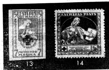
13 = Estland 14 = Lettland

Bis heute war die Schweiz eines der wenigen Länder, das seinem nationalen Roten Kreuze keine Marke bewilligt hatte. Umso erfreulicher ist es nun, dass der 75. Jahrestag der Unterzeichnung der Genfer Konvention Anlass zur Herausgabe der ersten eigentlichen Rotkreuzmarke in der Schweiz sein wird; ist doch kein Land dazu so berechtigt, wie gerade die Schweiz als Ursprungsland des Roten Kreuzes.