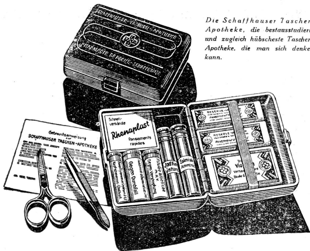
Die Schaffhauser Taschen-Apothek, die bestausstattete und zugleich hübscheste Taschen-Apothek, die man sich denken kann.

Die Nachrichten von Bern-Kirchfeld, Bülach, Lyss, Rütli, Uetendorf, Wädenswil, Wohlen und Zug erscheinen in der nächsten Nummer.