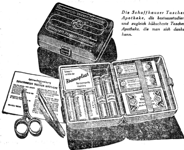
Die Schaffhauser Taschen-Apothek, die bestausgestattete und zugleich hübscheste Taschen-Apothek, die man sich denken kann.