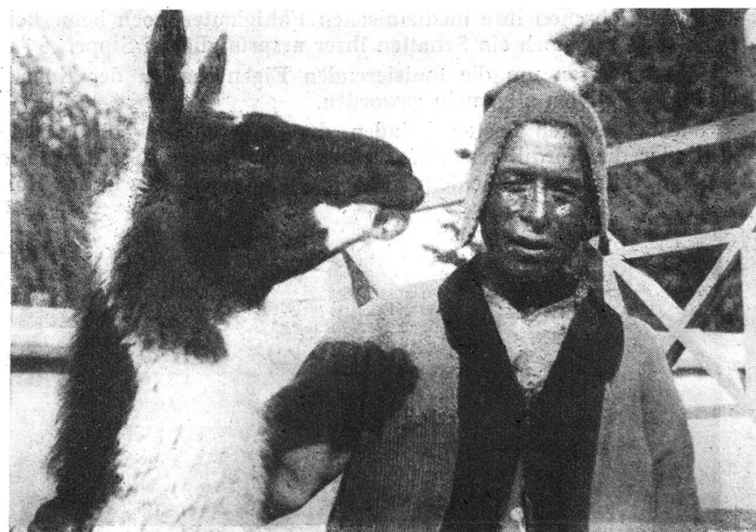
Ein Aymara-Indianer aus der Umgebung von La Paz mit seinem Lama.

Bienenwachs spielte in der damaligen Therapie eine bedeutende Rolle. Es wurde überall angewandt, wo das Verdunsten eines feuchten