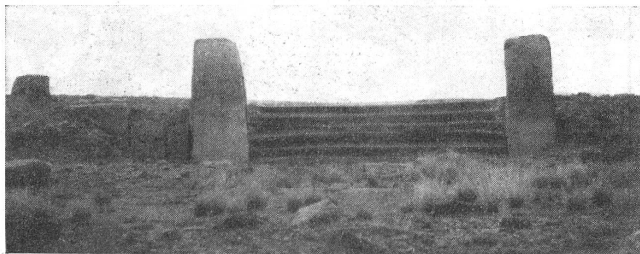
Ruinen des Sonnentempels in Tiahuanacu.

Leichte Lockerungsübungen lösen die Steife der Muskeln bei kühlem Wetter. Denke daran, sonst bekommst Du bei plötzlicher, heftiger Anstrengung eine Zerrung, die sehr langweilig sein kann.