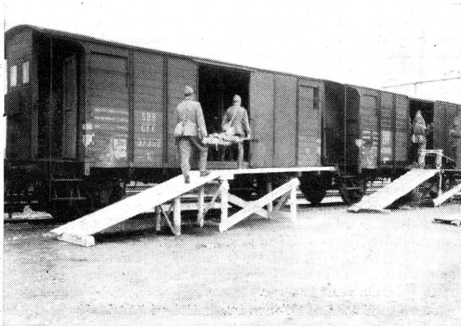
Verladen von Verwundeten in improvisierte Eisenbahngüterwagen.