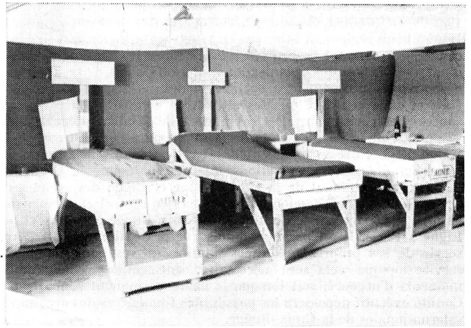
Improvisierte Betten für ein Feldspital. Die Betten sind aus einfachstem Material hergestellt.

einer Alarmübung verbunden war das Abkochen im Einzelkochgeschirr und nachfolgender Zeltbau und Verwendung der Zelleinheit als Wetterschutz. Den Abschluss bildete eine Felddienstübung im Kantonnementsraum Sissach, wo eine Uebernahmestelle, verbunden mit Gashilfsstelle eingerichtet wurde. Gleichzeitig erfolgte die Einrichtung von zwei Eisenbahngüterwagen für den Verwundetentransport, und es mussten auch kleine Transportmittel für denselben Zweck improvisiert werden.