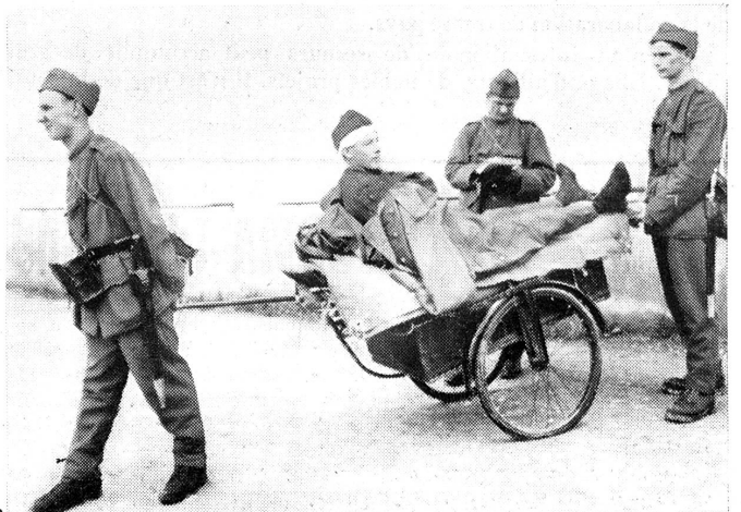
Für Verwundetentransport eingerichteter Fahrradanhänger.