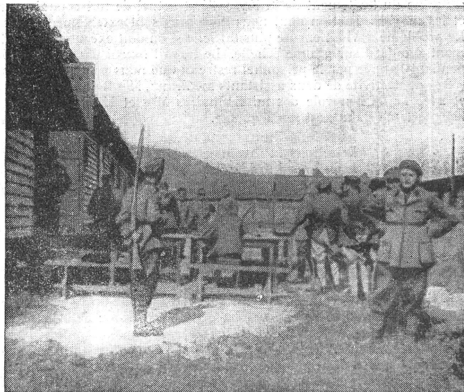
Prisonniers français arrivant au camp. — Ankunft französischer Gefangener im Lager.

2 o Le «L-Lager» où sont réunis 670 Juifs polonais, 820 hommes de couleur, 25 Belges et 50 Anglais.