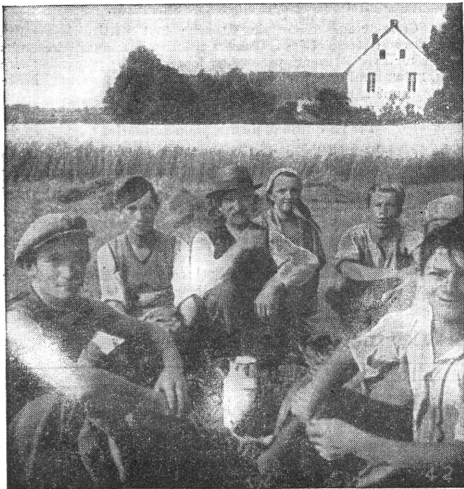
Prisonniers français en Allemagne. — Prisonniers français à la campagne avec des paysans allemands. — Französische Gefangene in Deutschland. — Französische Gefangene auf dem Lande bei deutschen Bauern.

Les prisonniers qui travaillent reçoivent 13,50 marks par mois, dont 8 marks leur sont retenus et donnés à ceux de leurs camarades qui ne travaillent pas. Les soldats français, même sans travailler, touchent 4 pfennigs par jour. Les officiers et sous-officiers touchent leur solde complète.