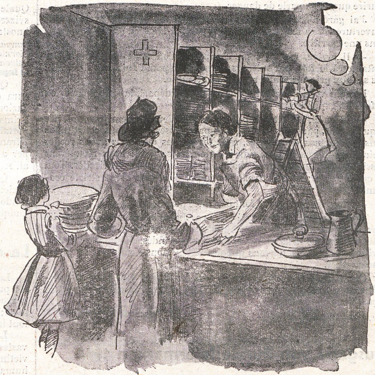
Sammelstelle des Roten Kreuzes für Spitalwäsche

Gedenket der Sammlung für die Schweiz. Nationalspende und das Schweiz. Rote Kreuz!