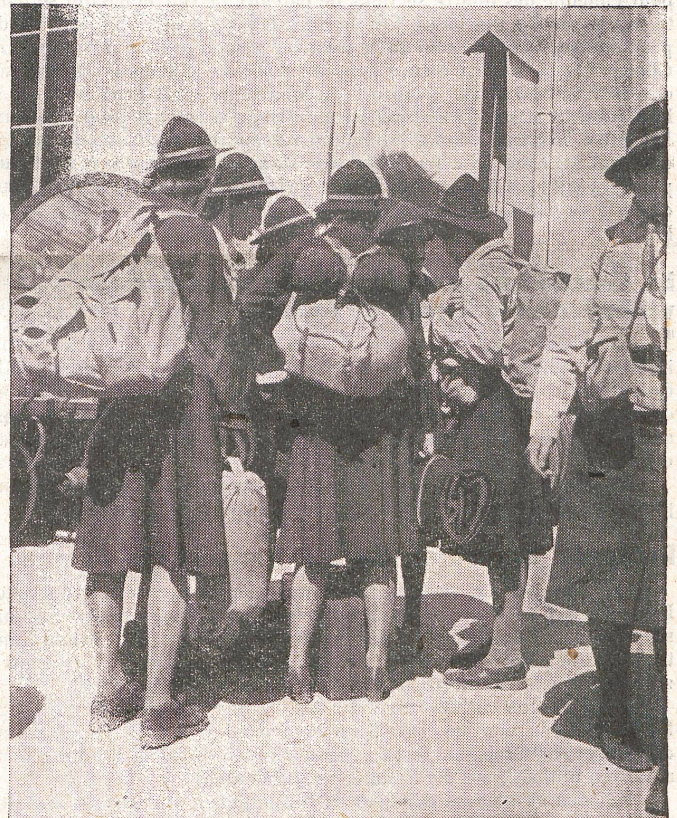
Pfadfinderinnen rücken ein, um ihre Kameradinnen in der M. S. A. abzulösen Zens.-No. III 1119

Das dänische Rote Kreuz in Kopenhagen und das norwegische Rote Kreuz in Oslo ersuchten ihrerseits das internationale Komitee vom Roten Kreuz, die Uebermittlung von rein persönlichen Nachrichten zu übernehmen, die an Familienangehörige der beiden Länder gerichtet sind. Etwa 100 derartige Mitteilungen konnten an die Adressaten vermittelt werden.