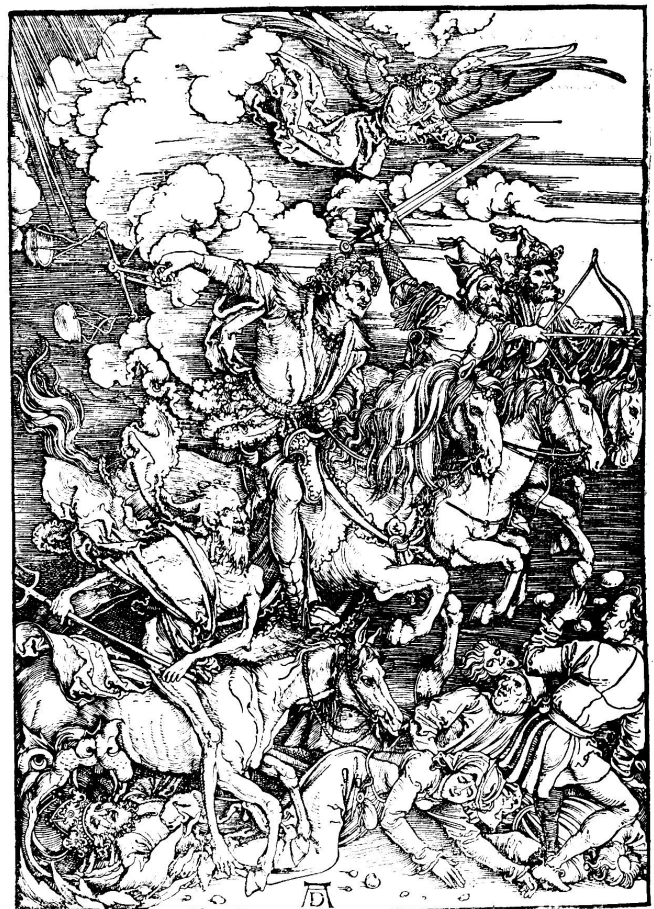
Albrecht Dürer: Die apokalyptischen Reiter. Holzschnitt.

Am 10. Oktober 1921 eröffnete das Schweiz. Rote Kreuz eine Sammlung zur Ausrüstung einer Spitalexpedition nach Russland. Mitgefühl und Erbarmen siegten über die tiefe Abneigung gegen die Ideologie der Sowjetunion, so dass die Sammlung allein in der Schweiz binnen