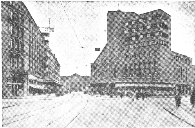
Das moderne Biel. - Bienne moderne