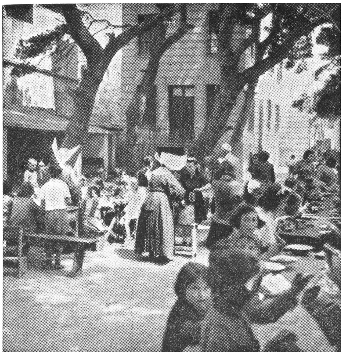
Suppenküche im Quartier Calamaria in Saloniki.

Centre de soupes enfantines au quartier Calamaria à Salonique.