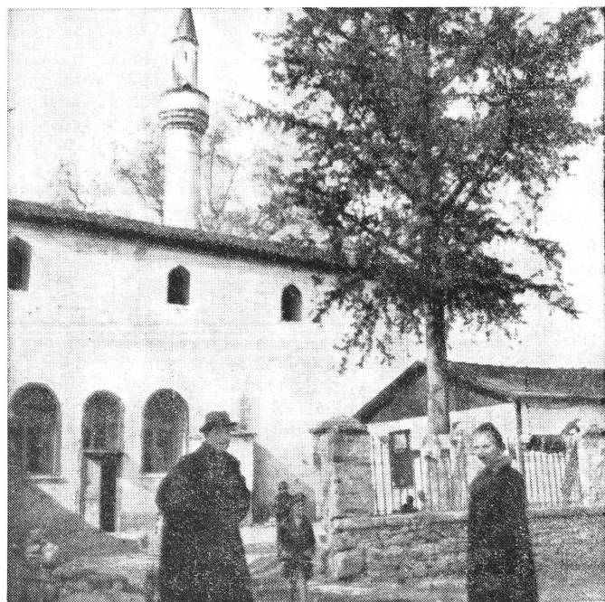
Aussenansicht der orthodoxen Kirche von Verria.

... puis elle leur est distribuée par une Albanaise dans une église orthodoxe