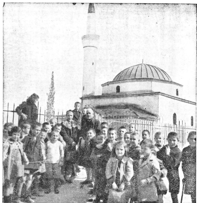
In der Ortschaft Verria (Mazedonien) wird die Suppe für die Kinderspeisungen in einer Moschee zubereitet...

Les vivres reçus de la Croix-Rouge suisse directement du pays ou d'Athènes furent complétés par ceux fournis gratuitement par