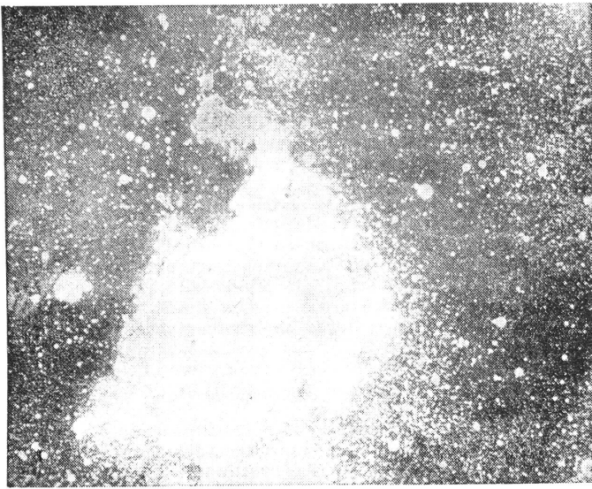
Nordamerika - Nebel im Sternbild des Schwans