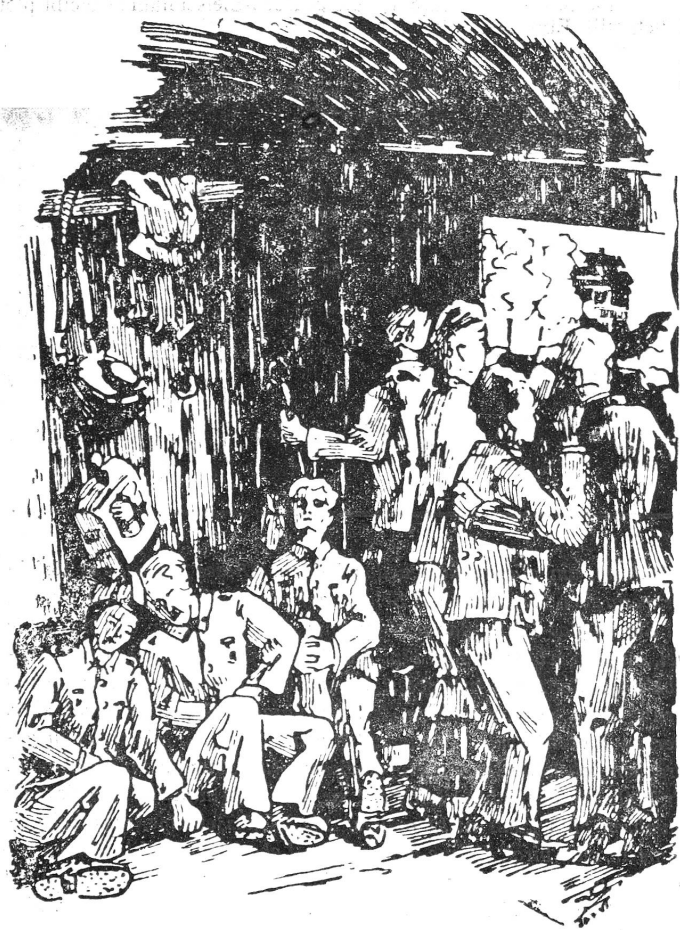
Unbekannte Dörfer und Städte fliegen an den kleinen Fenstern vorbei. Certains somnolent, d'autres observent les fugitives images du paysage; dans un coin on parle d'hier, dans un autre de demain...