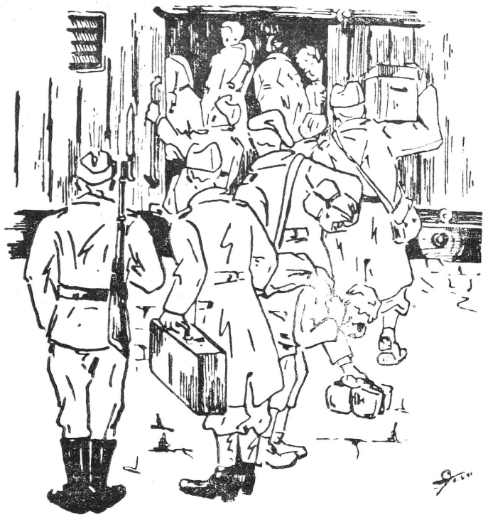
Abfahrt ins «Kommando». Départ pour le «Kommando».

Das Suchen nach einer Unterkunft füllt den ersten Tag im «Kommando» aus. Anderntags beginnt die Arbeit. Beim Morgenappell fassen die Kriegsgefangenen das Werkzeug, und sie werden auf einen Bauplatz geführt. Die Arbeit wird rasch organisiert und das Hin- und Herrollen der kleinen Rollwagen zwingt bald jeden in den Arbeitsgang. Die Arbeit ist ungewohnt, es fehlt an Begeisterung, bald schmer-