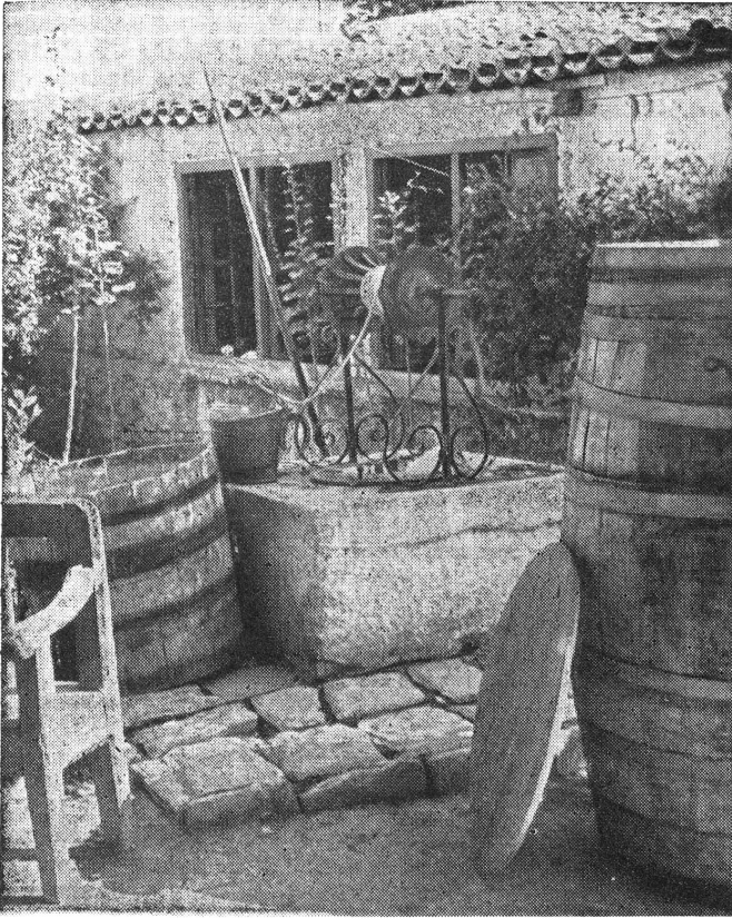
Eines der vielen kleinen Häuser in Athen, die als Milchverteilungszentren dienen.

L'une des nombreuses maisonnettes d'Athènes, servant de centre de distribution du lait.