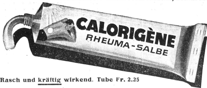
Rasch und kräftig wirkend. Tube Fr. 2.25

Wohlen (Aarg.). S.-V. Uebung: Mo., 22. Nov., 20.00, im Bezirksschulhaus, Zimmer 1. Da wir alle jene Mitglieder, welche die vorgeschriebenen Uebungen nicht besuchen, unnachsichtlich zu den Passiven versetzen müssen, erwarten wir vollzähligen Besuch. Bitte ausstehende Mitgliederbeiträge mitbringen.