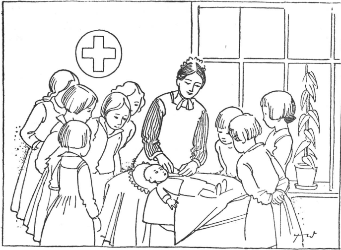
Les juniors apprennent la puériculture. Die kleinen Junioren lernen die Säuglingspflege.