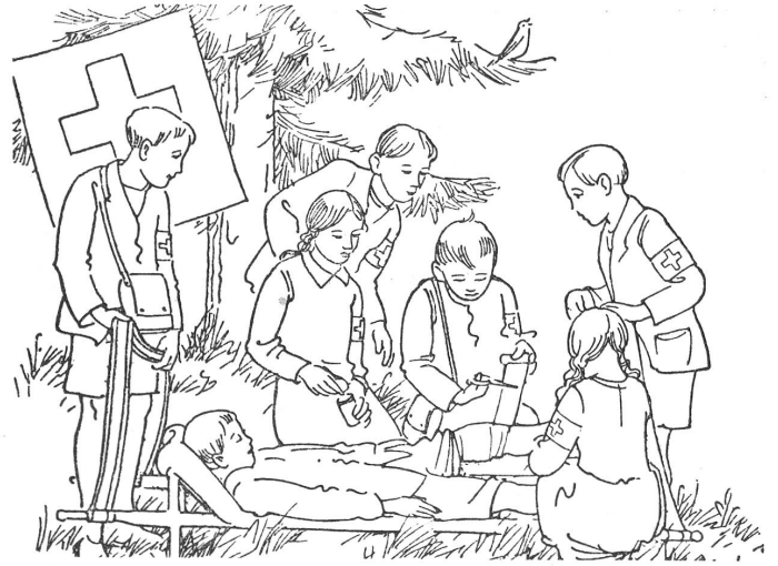
Une leçon de premiers secours Eine Samariterübung

La misère régnant en Grèce inspira même aux juniors de certaines écoles françaises un geste dont la valeur n'a pas besoin d'être soulignée: sacrifiant leur maigre ration de vivres et de chocolat, ils l'envoyèrent à ceux dont les besoins étaient plus urgents que les leurs.