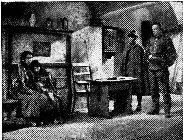
Flüchtlinge werden an der Grenze in Empfang genommen. (Aus dem Jubiläumsfilm «Die letzte Chance».) Les réfugiés sont accueillis à la frontière. (Du film du jubilé: «La dernière chance».)

Die Schweiz beherbergt heute 15—20'000 staatenlose Flüchtlinge. Sie sind hilfsbedürftig. Sie rufen nach einem Rechtsschutz für die Zukunft . Einen Rechtsschutz gibt es nicht ohne internationales Statut. Als souveränes Mitglied der Völkergemeinschaft und durch eigene Interessen gezwungen, ist die Schweiz antragsberechtigt, um vor dem Weltforum eine Lösung für diese Unglücklichen in Fluss zu bringen.