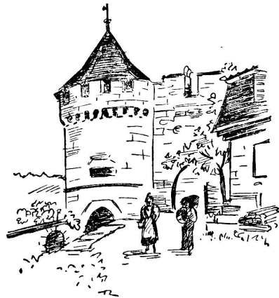
Alt-Luzern: Der Nölliturm.

Und Graf Tolstoi, der grosse russische Dichter, wie er nach Luzern kommt, ist hingerissen von der «eigentümlich grossartigen und zugleich unaussprechlichen harmonischen Natur, geblendet und im ersten Augenblick erschüttert von der Schönheit dieses