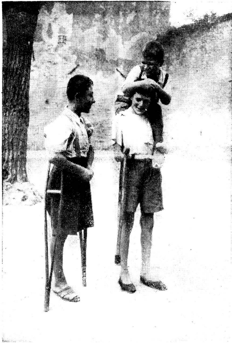
Casa d'Arosio, zwischen Mailand und Como. Das gleiche Schicksal verbindet diese kriegsverküppelten Kinder zu warmer Kameradschaft