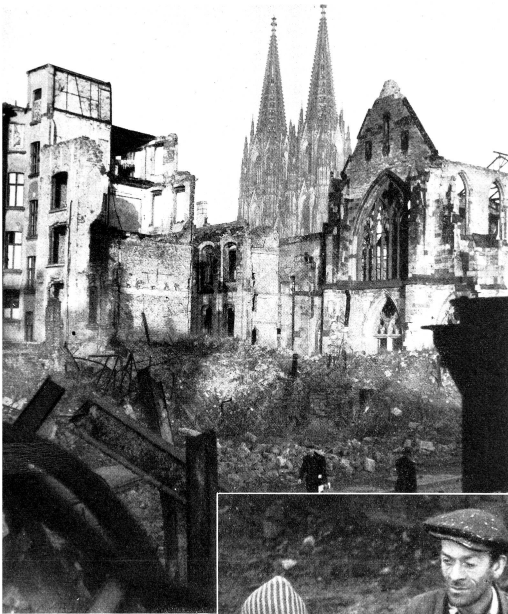
Köln, die Ruinenstadt!