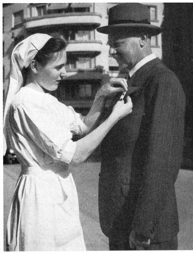
1 Wir sammeln für die Gründung einer Oberschwesterenschule, für die Werbung von Pflegepersonal und für die Unterstützung von kranken und betagten Schwestern.