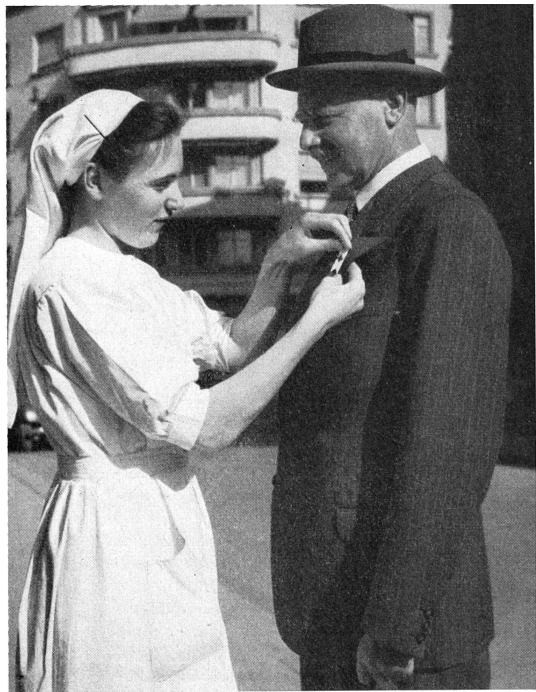
1 Wir sammeln für die Gründung einer Oberschwesternschule, für die Werbung von Pflegepersonal und für die Unterstützung von kranken und betagten Schwestern.