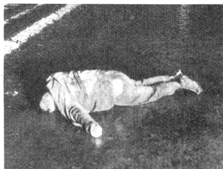
Ein schwerer Strassenunfall.