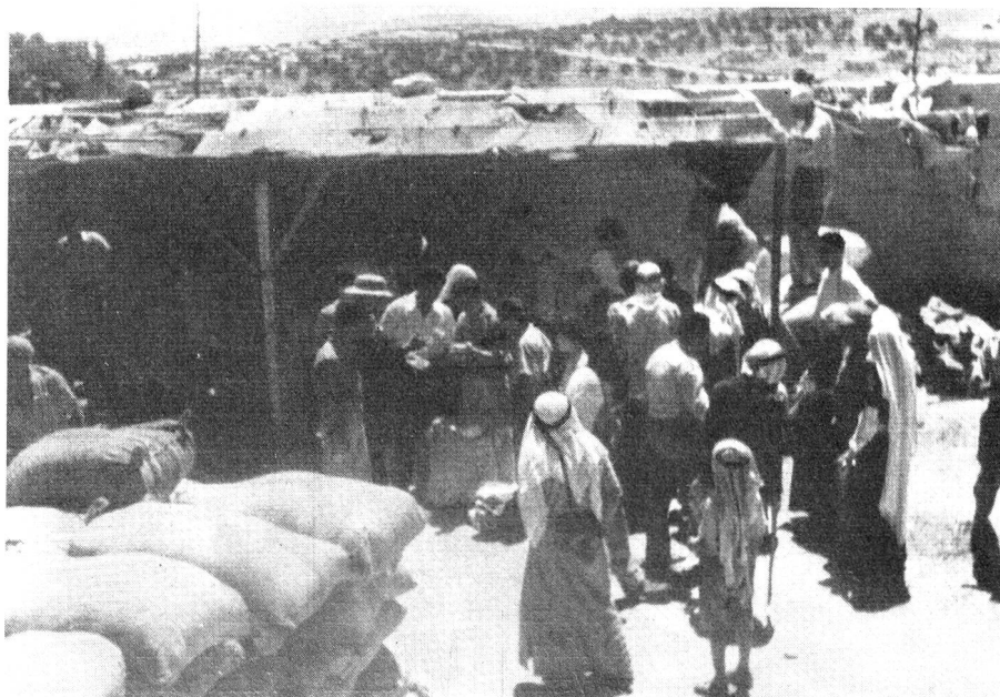
Verteilung von Lebensmitteln an Flüchtlinge in einem Lager von Jordan-Palästina.

Arbeit wuchs mit jedem Tag. Es genügt, daran zu erinnern, dass die Zahl der Schweizer, die im Jahre 1949 zwanzig, später dreissig betrug, heute zu fast hundert angewachsen ist; sie werden zudem durch ein Ortpersonal von ungefähr 2000 bezahlten Kräften — Aerzten, Assistenten, Angestellten und Arbeitern aller Kategorien — unterstützt.