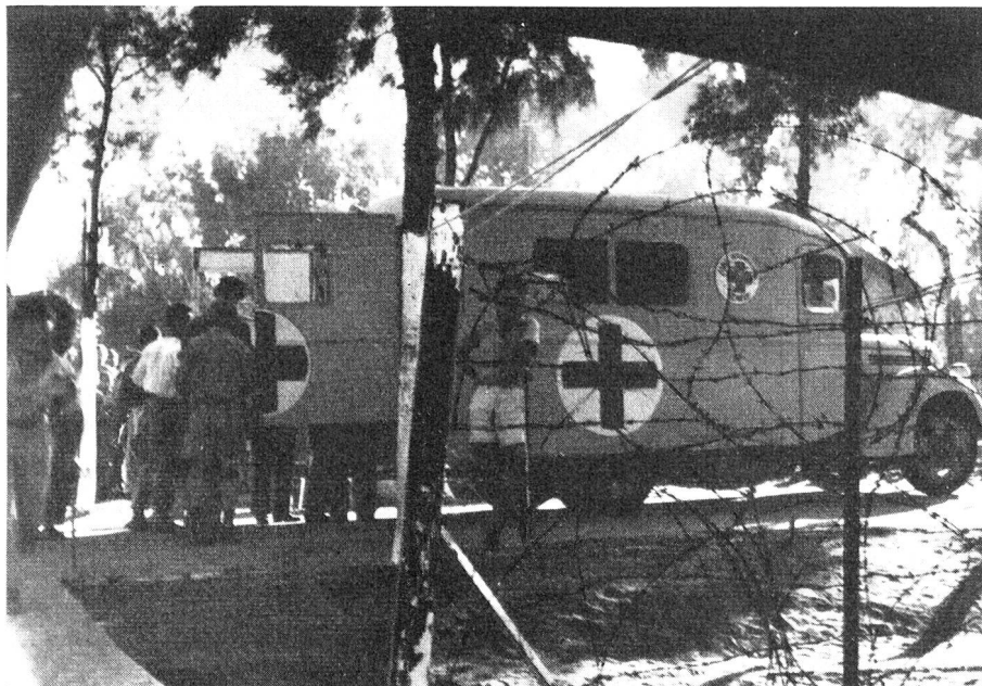
Ambulante Poliklinik des Internationalen Komitees vom Roten Kreuz in Jordan-Palästina.

Auch heute sind die Anstrengungen nicht kleiner geworden. Es gibt Tage, an denen zwanzig Stunden gearbeitet werden muss. Hunderte von Kranken werden vor- und nachmittags in den Polikliniken zu Stadt und Land behandelt. Die leichtkranken Flüchtlinge werden an Ort und Stelle betreut, während die Schwerkranken auf die Spitäler verteilt werden, die unter schweizerischer Kontrolle stehen. Frauenspitäler und Säuglingsheime sowie Schneider-, Schreiner- und Schuhmacherwerkstätten stehen überall in Betrieb. Die An-