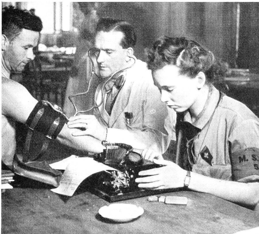
Eine Pfadfinderin als Arzt-Sekretärin in einer MSA.

Sanitätshilfe in weitem Masse in die berufliche oder freiwillige und ausserdienstlich zivile Ausbildung hineingreift, kann sie nicht Aufgabe der Armee sein, sondern wurde dem Schweizerischen Roten Kreuz als einer neutralen Betreuerin übertragen.