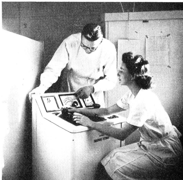
Spezialistin als Gehilfin des Arztes in einer MSA.

Wenn ich recht verstehe, ist die Freiwillige Sanitätshilfe nicht eigentlich ein Bestandteil der Armee, sondern hat eher eine Zwischenstellung zwischen Armee und Zivilleben. Bleibt diese Organi-