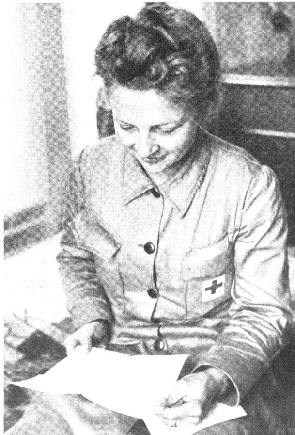
Eine Samariterin, die während der letzten Mobilisation einer MSA zugeteilt war, beim Lesen der Post von zu Hause.

Nein! Es ist eine wesentliche Aufgabe, vor allem der Rotkreuz-Kolonnen, aber auch vieler Samariterinnen, sich freiwillig für andere Katastrophenfälle oder bei Epidemien auch in Friedenszeiten zur Verfügung zu stellen. Gerade weil die Freiwillige