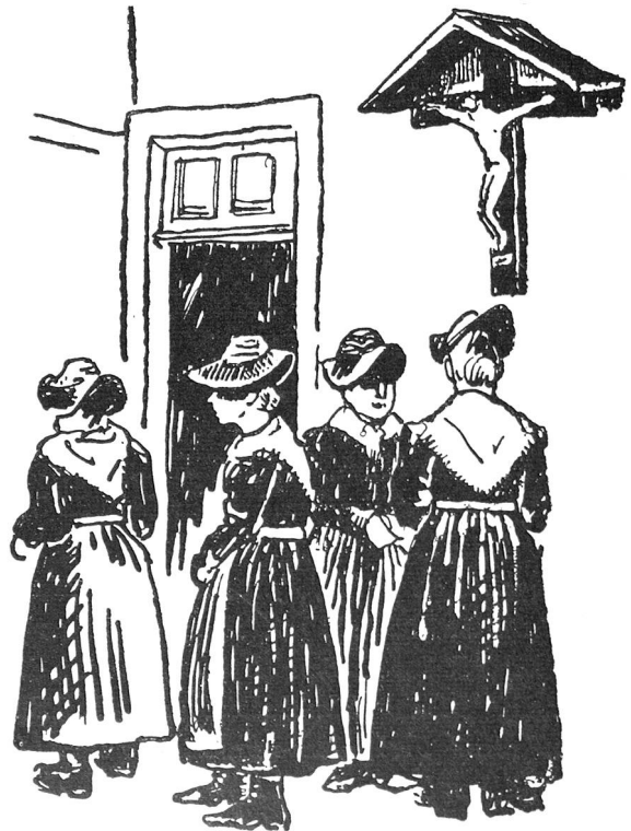
Skizzen von Hugo Bachmann aus «Alpineum Helveticum», Verlag Ernst Bachmann, Luzern.

Wir hoffen, dass die Delegierten und Freunde des Schweizerischen Roten Kreuzes in grosser Zahl der herzlichen Einladung Folge leisten werden, welche die Sektion Siders und Umgebung an sie richtet.