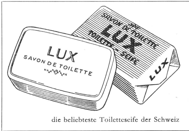
die beliebteste Toiletteseife der Schweiz