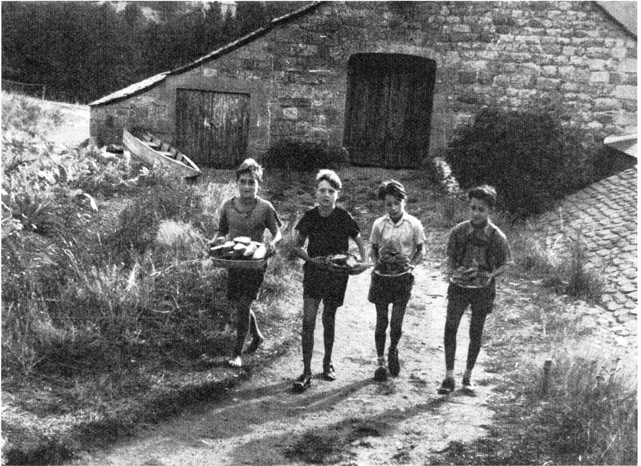
Die Gruppe der «Eichhörchen» holt das Frühstücksbrot aus der Küche. Die Ferienkolonien in Le Chambon werden «pfadfinderisch» geführt. Dienen und helfen! Die vier Buben auf unserem Bilde gehören vier verschiedenen Nationen an und sind die besten Freunde.

Für Grosstadtkinder bietet die wilde und weite Natur der Umgebung von Le Chambon Quell unzähliger Freuden und Erlebnisse. Felsbrocken, Weiden, Wälder, Wolken und Wind laden zu Wanderungen und Abenteuer ein, und die Kinder geniessen die ungebundenen, von keinen Mauern eingeengten Ferientage in vollen Zügen.