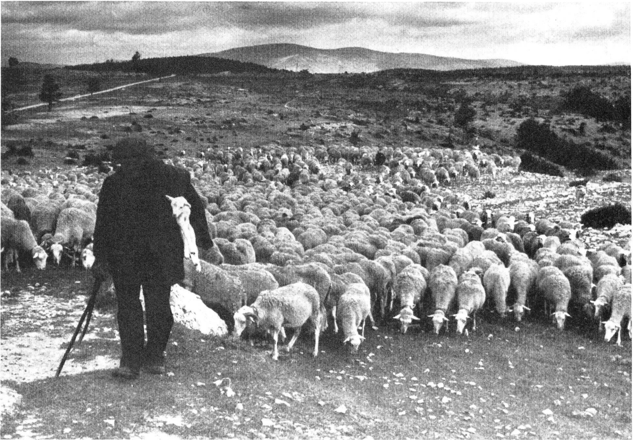
Ein anderer Hirt mit seinen Schafen! Weideland in der Umgebung von Le Chambon.

vierteln der Großstädte oder aus den Lagern von «displaced persons», so dass sich die Kolonieleiter mit den absonderlichsten Temperamenten auseinanderzusetzen hatten.