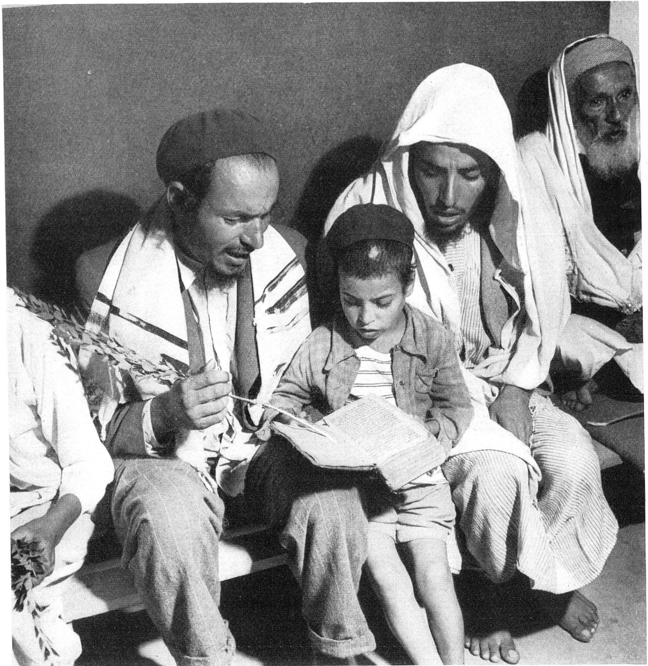
Es ist die Pflicht eines jeden Jemen-Juden, seinen Sohn in die Bibel einzuführen, sobald dieser beginnen kann, sie zu verstehen. Hier zeigt ein Vater seinem Sohn, wie die bis jetzt nur zum Beten verwendete Sprache der heiligen Bücher als Gebrauchssprache in der täglichen Rede angewendet werden kann.

Morgen freuen kann. Denn ist nicht die Bibel das Buch der Verheissungen? der hoffenden Gewissheit? der von Gott zugesicherten Erlösung? Wer sitzt im Kerker, und sei er noch so dunkel, und freut sich nicht, wenn er weiss, dass die Befreiung, die Freiheit selber mit ihrem goldenen Schimmer ganz sicher und bestimmt kommen wird?