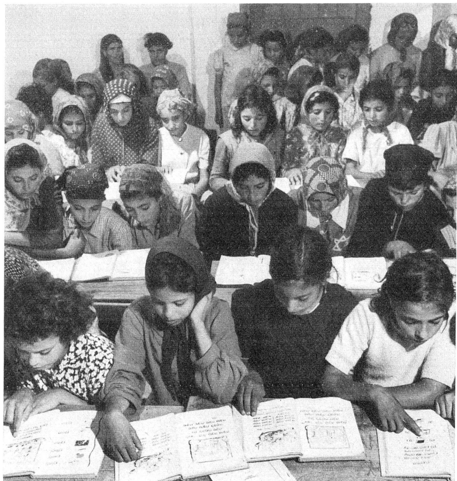
Schulpflichtige Kinder jeden Alters lernen die hebräische Sprache als Umgangssprache. Mädchen und Knaben werden getrennt unterrichtet.

Gibt es nicht zu denken, dass gerade den Frauen der Brauch obliegt, die Sabbathlichter anzuzünden und zu hüten? Eigentlich sollte der Sabbath licht- und feuerlos begangen werden; das Verbot des